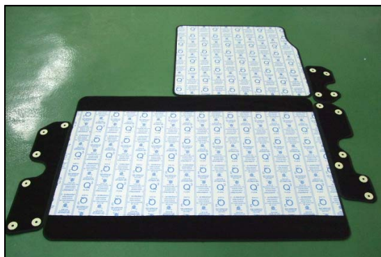
裏面、ズレ防止機能有り