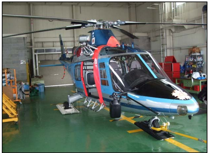
Q3・防護シートを機内に敷く前