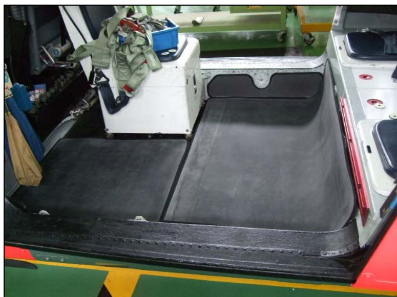
機内にQ3防護シートを敷いて有るようす。